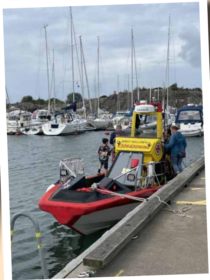
Såväl polisen som sjöräddningen var på plats. - På besök alltså, inga tjänsteärenden...