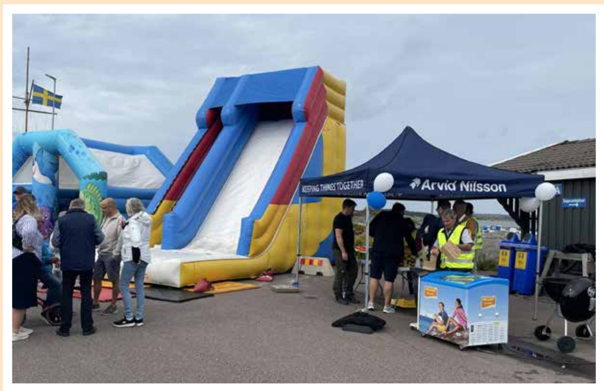
Dagen bjöd även på hoppborgar, lotterier, tipspromenader. Och sist men inte minst, grillkorv och glass till barnen!