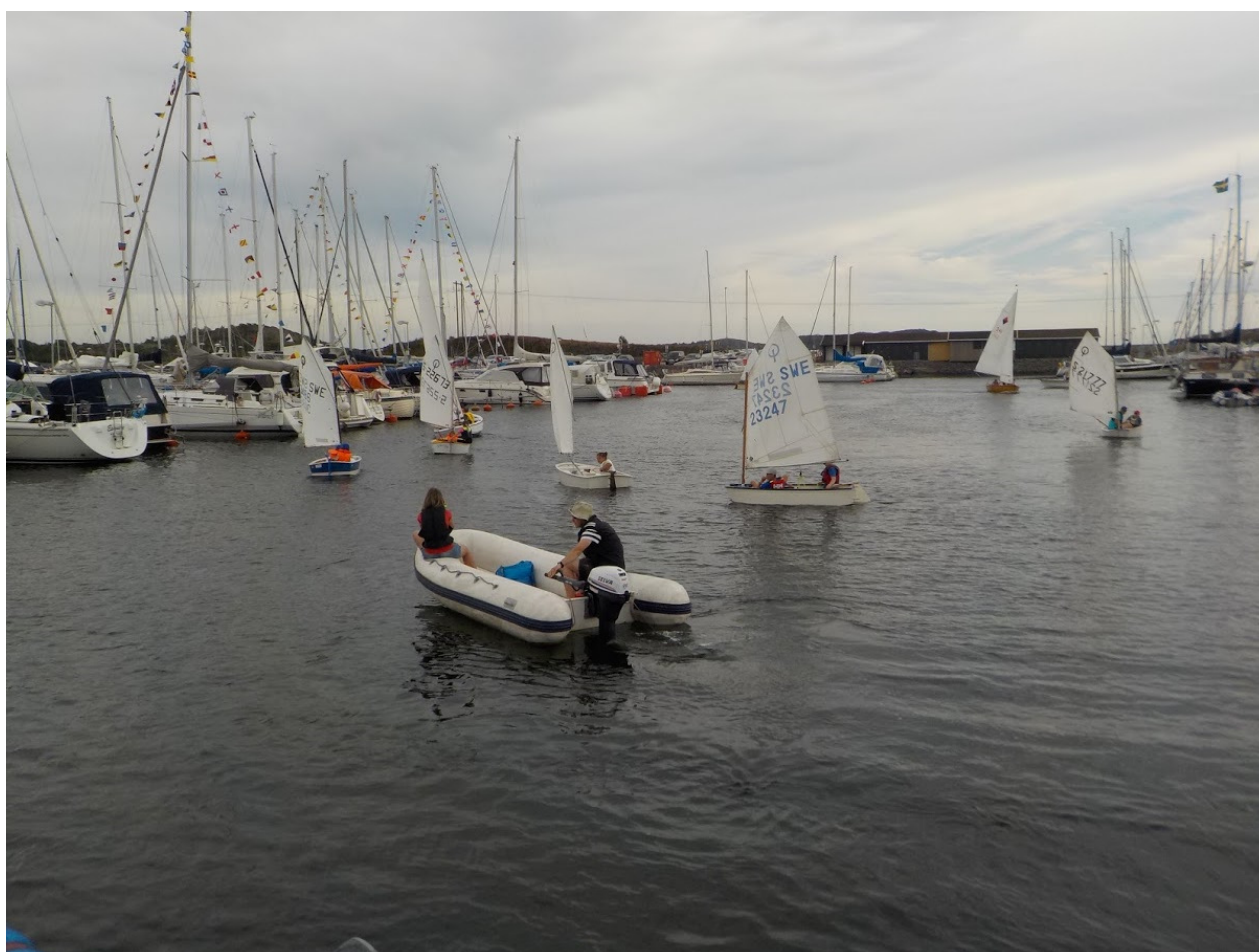
Nordöhamnens 40 års jubileum 2018