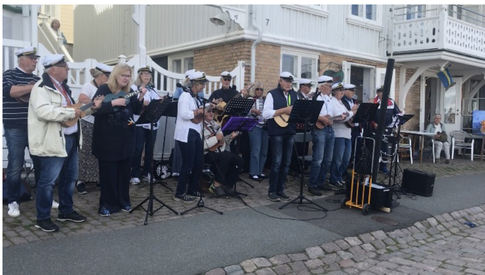
Styrbords halsar på Marstrand

Vi sitter på altanen och njuter av solen.