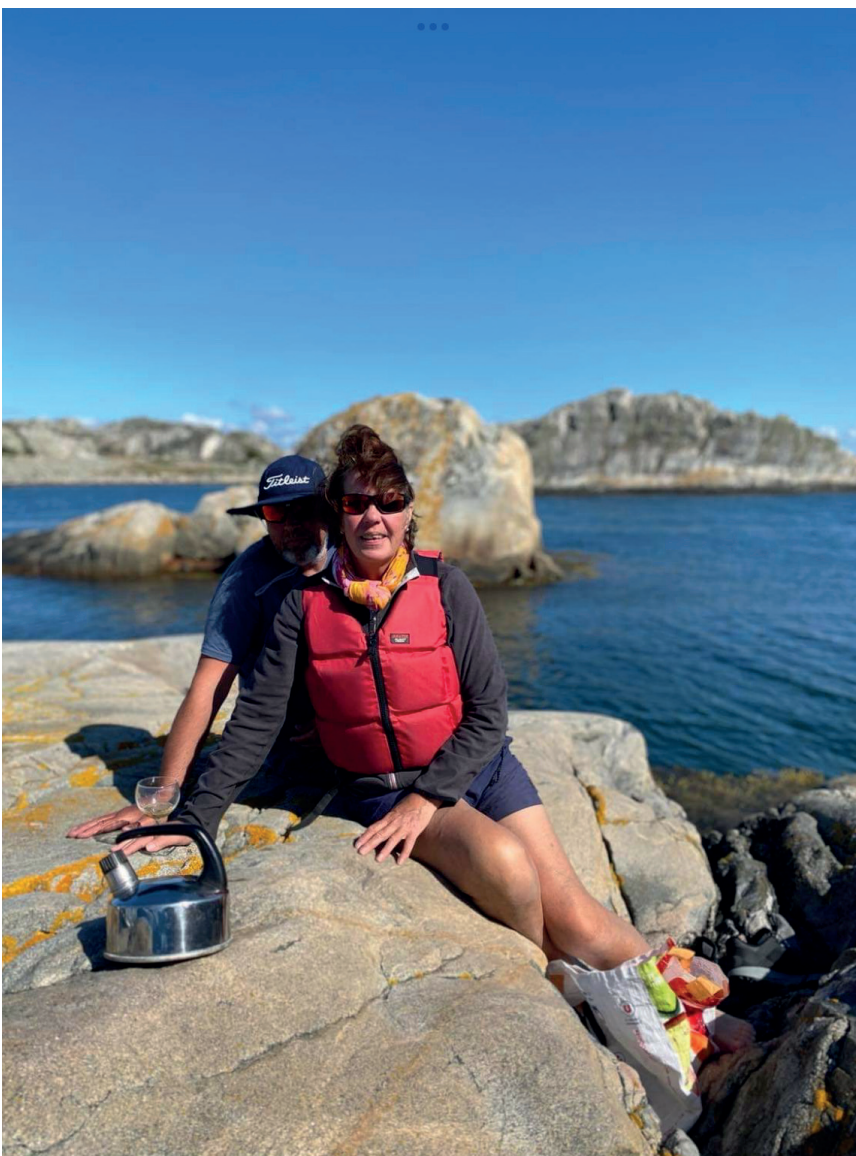
Vattenkittel med vissla är perfekt ombord

Köp fyrkantiga plasttallrikar med en liten kant så inte såsen rinner över. Fyrkantiga tallrikar är lättare att stuva. Jag gjorde misstaget att köpa runda plasttallrikar utan kant på Clas Ohlson. All mat på tallriken rasade av och hamnade på durken. Synd!