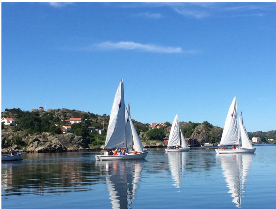
Krokholmslägret 2017